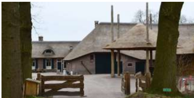
Het Gagelgat in Soest

Voor het bezoek aan Soest en voor dat aan Lunteren kunt u zich al opgeven. Voor de lunches wordt wel een bijdrage in de kosten gevraagd. ✉ TBorggreve44@kpnmail of ☎ 0318-483819.